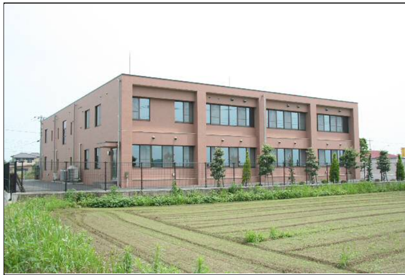
葛西用水路土地改良区事務所