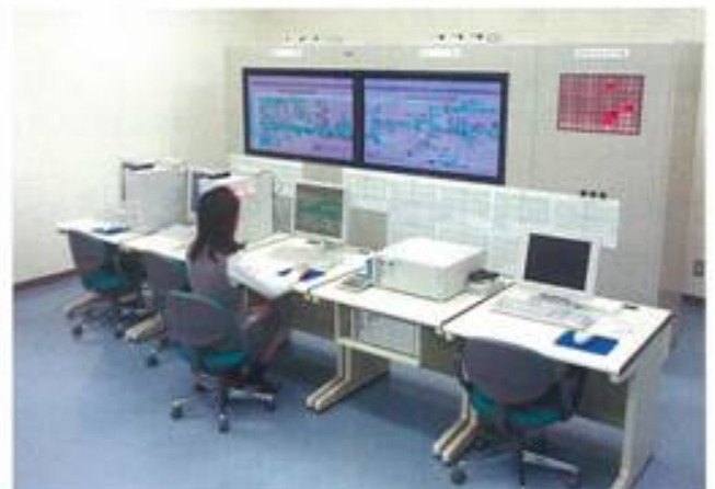
プラズマTV（50インチ×2面） パソコン4台（監視用2台、操作用1台、記録用1台）