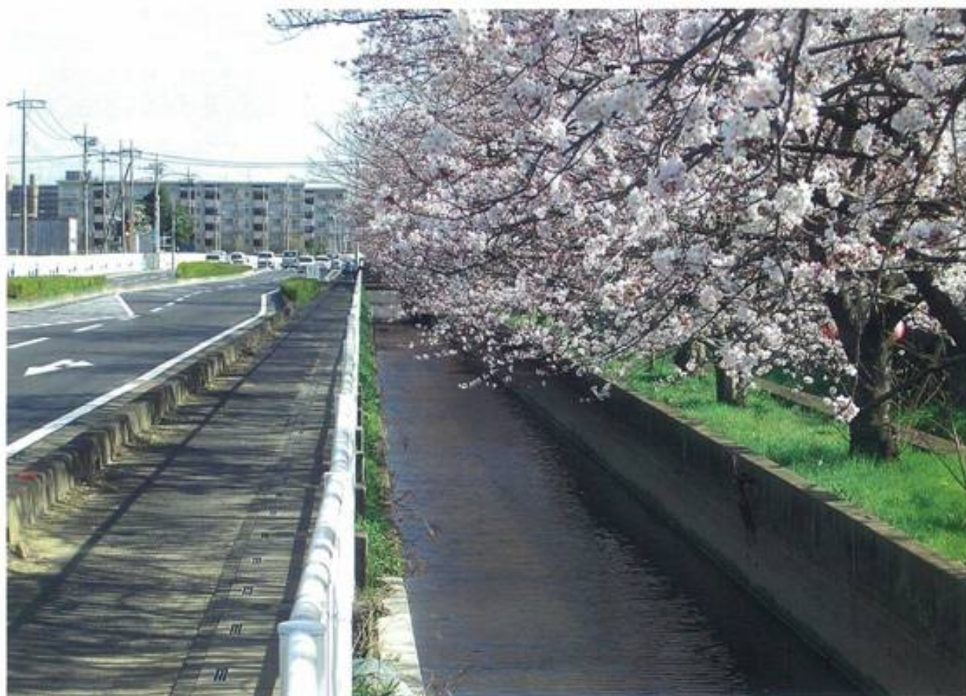
二郷半領用水路 吉川市川富地内