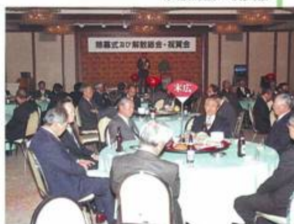
除幕式及び 解散総会・祝賀会