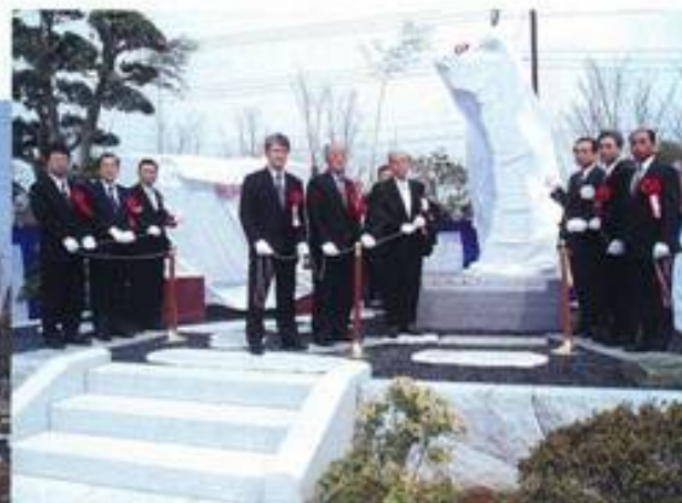
記念モニュメント及び 記念碑除幕式