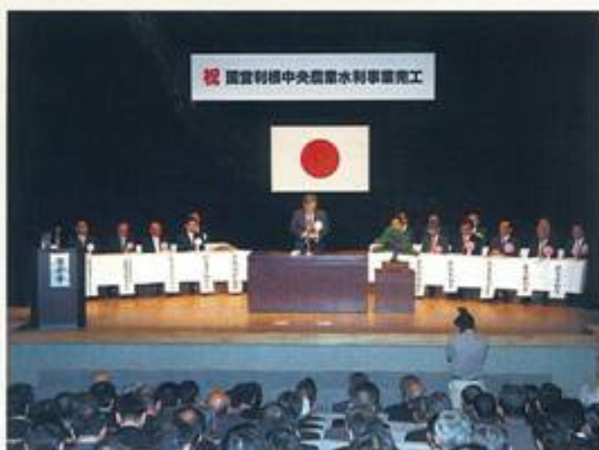
完工式 久喜市総合文化会館

国営利根中央農業水利事業は、平成4年着工以来、12年の歳月と1,050億円の事業費を投じ、地元をはじめとする関係各位の絶大なるご支援、ご協力により完工し、去る、平成15年10月24日「久喜市総合文化会館」に於いて完工式典を実施し、引き続き「久喜市ニュー八雲」に於いて完工祝賀会を利根中央事業促進協議会主催により開催し、関係者250名余のご列席により盛大に行われました。