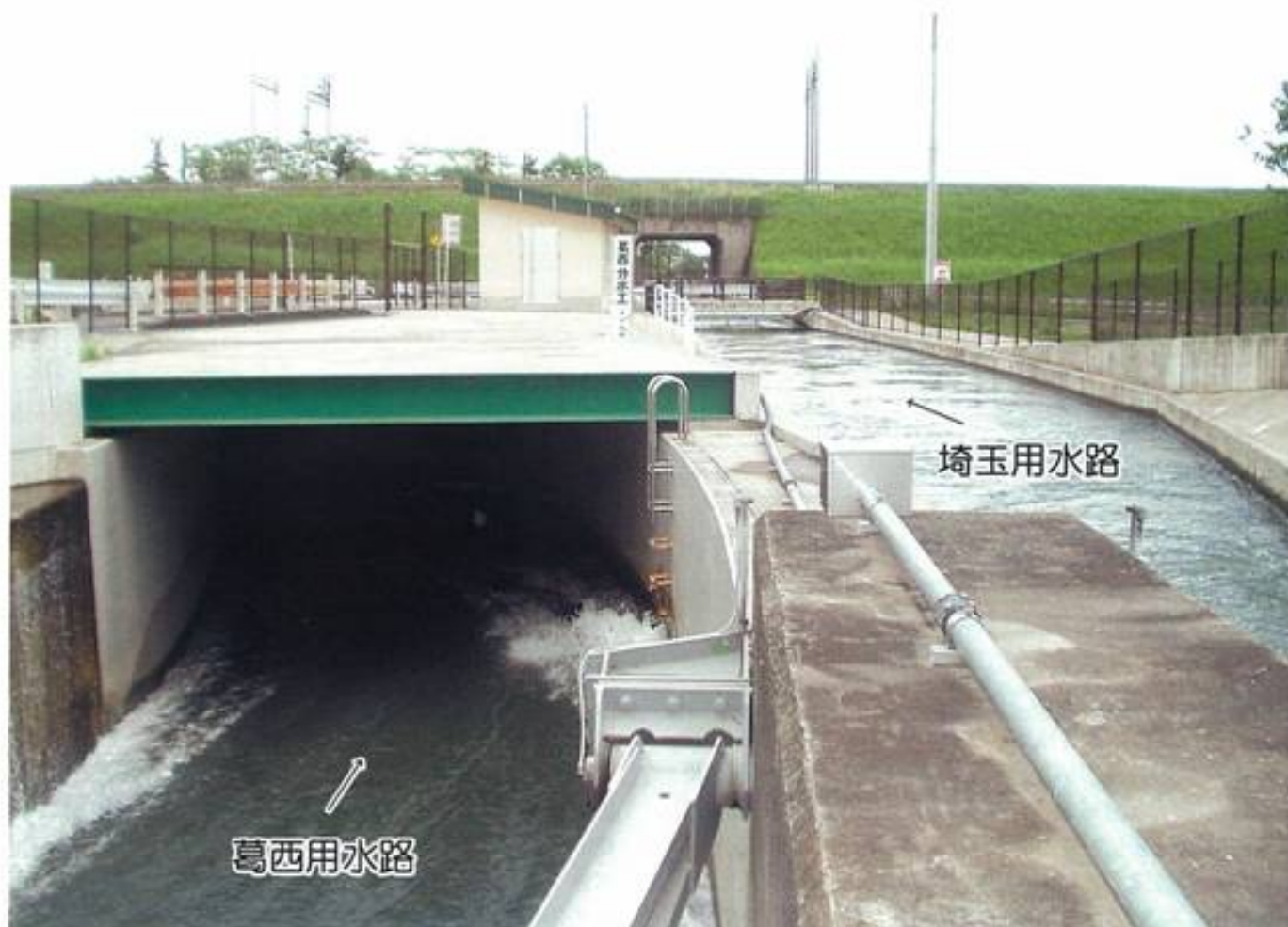
葛西分水工 羽生市本川俣