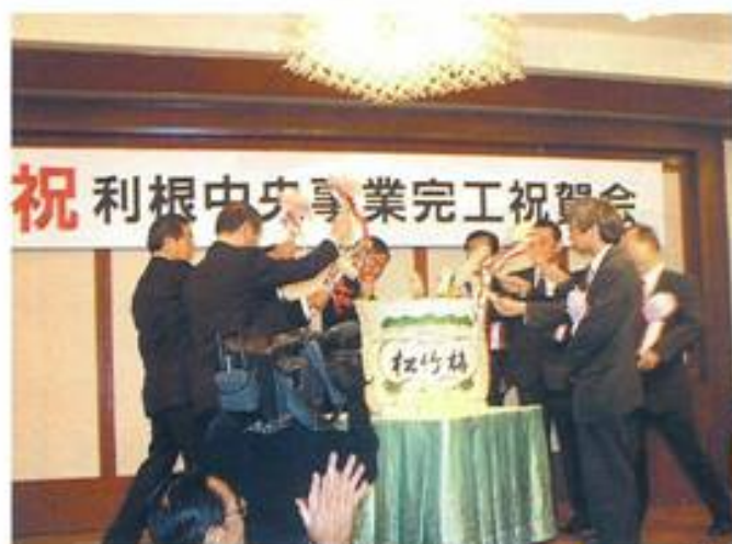
完工祝賀会 久喜市ニュー八雲